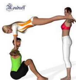
Figura per a 3 persones