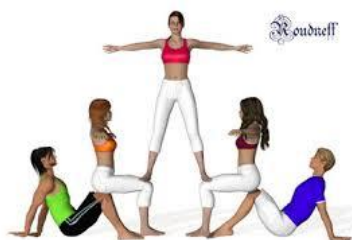
Figura per a 5 persones