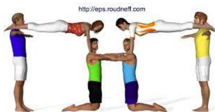
Figura per a 6 persones