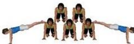
Figura per a 7 persones