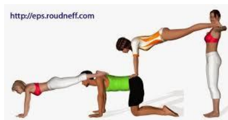
Figura per a 4 persones